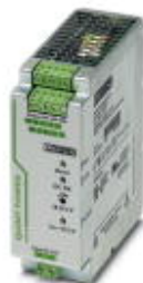
Преобразователь DC QUINT для установки на несущей рейке с технологией SFB (Selective Fuse Breaking), первичный такт, вход: 24 В DC, выход: 24 В DC / 10 А

Обратите внимание на то, что приведенные здесь данные взяты из online-каталога. Полная информация и данные содержатся в документации пользователя. Действуют Общие условия использования для информации, загруженной из интернета. ( http://phoenixcontact.ru/download )